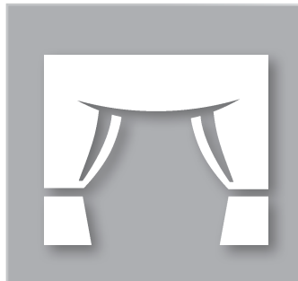
Abb.: Bevorzugter Einsatz im Unternehmenstheater